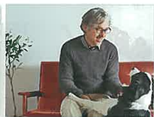
ペットがいるご家庭