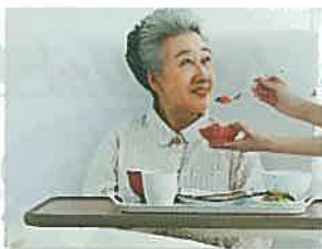
在宅介護のご家庭