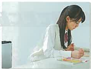
受験生のいるご家庭