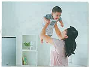
妊婦さんや乳幼児がいるご家庭