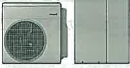
貯湯ユニット SH-GTC2401A BL ヒートポンプユニット HP-2201 BL