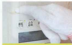
① コントロールパネル

作り方は簡単。まず、家庭用ビニール手袋をはめる。次に、その上に軍手を重ねて装着。最後に、ビニール手袋のすそを折り返せば出来上がりです！