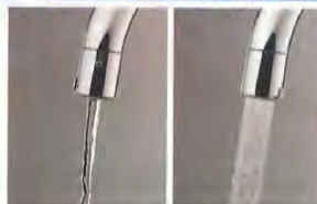
浄水ストレート・浄水シャワー

蛇口一体型浄水器でありながら豊富な流量によって、原水/浄水とストレート/シャワーの4つの水形切替が可能です。洗い物をする時などの手の動作を最小限に抑えられます。塩素を除去した浄水シャワーは、野菜を洗ったり、お米を研ぐときなど料理の下ごしらえに便利です。