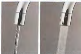
原水ストレート・原水シャワー