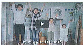
RDT54S CM 乾太くんにお任せだ編