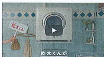
RDT54S CM 乾太くんがやってきた編