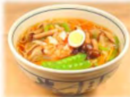
あんかけにゅうめん